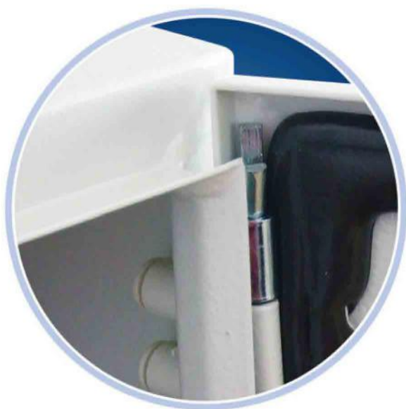
Петля и уплотнение из вспененного полиуретана